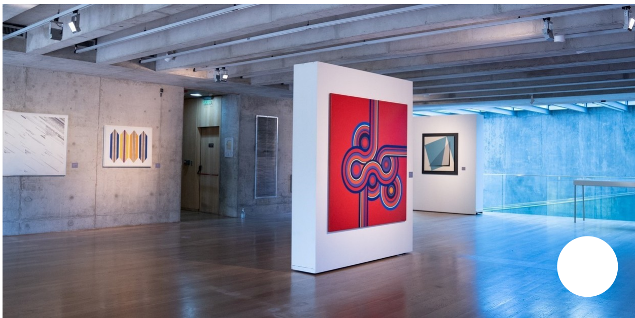
Arte geométrico, muestra MACBA. Apertura Arte Ñ

Con obras de unos 80 artistas, una muestra recorre en el MACBA los últimos 50 años de la pintura geométrica en el país y los cambios que produjeron la experimentación y los nuevos formatos, ideas y materiales.