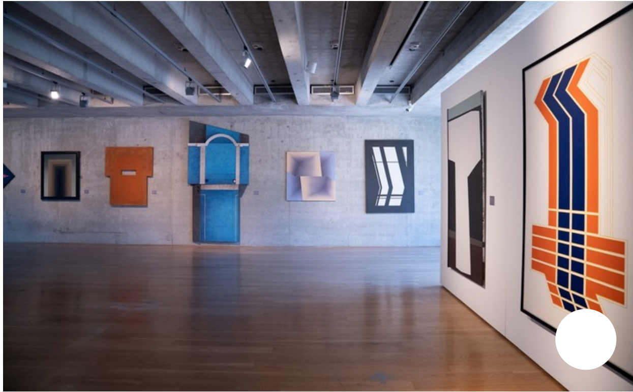
Un sector de "Neo Post, 50 años de pintura geométrica en Argentina 1970-2020".